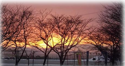
冬：雪景色の夕暮れ