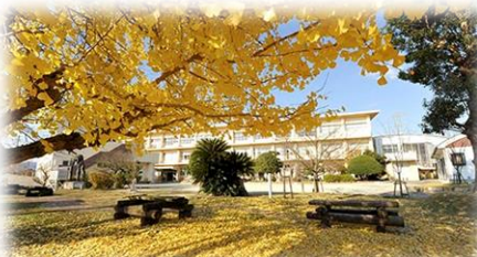
秋：校庭を彩る銀杏の木