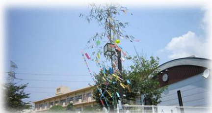
夏：校門横の七夕飾り